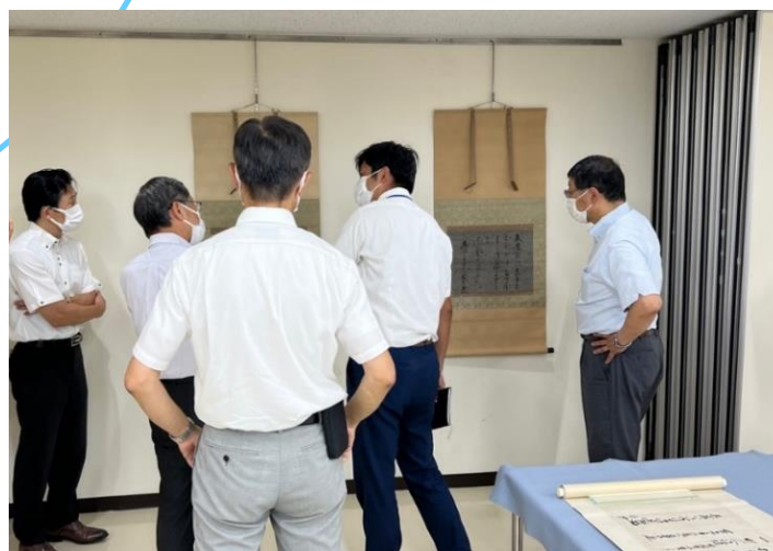
高等学校教員 ワークショップ型研修