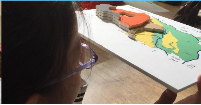
立体地図作りと作った地図を使った調べ学習（小4）

埼玉県立文書館は、県内ゆかりの古文書、埼玉県の行政文書、地図、県史編さん資料など、埼玉県に関する歴史的・文化的に価値のある資料を保存・整理・活用している教育機関です。