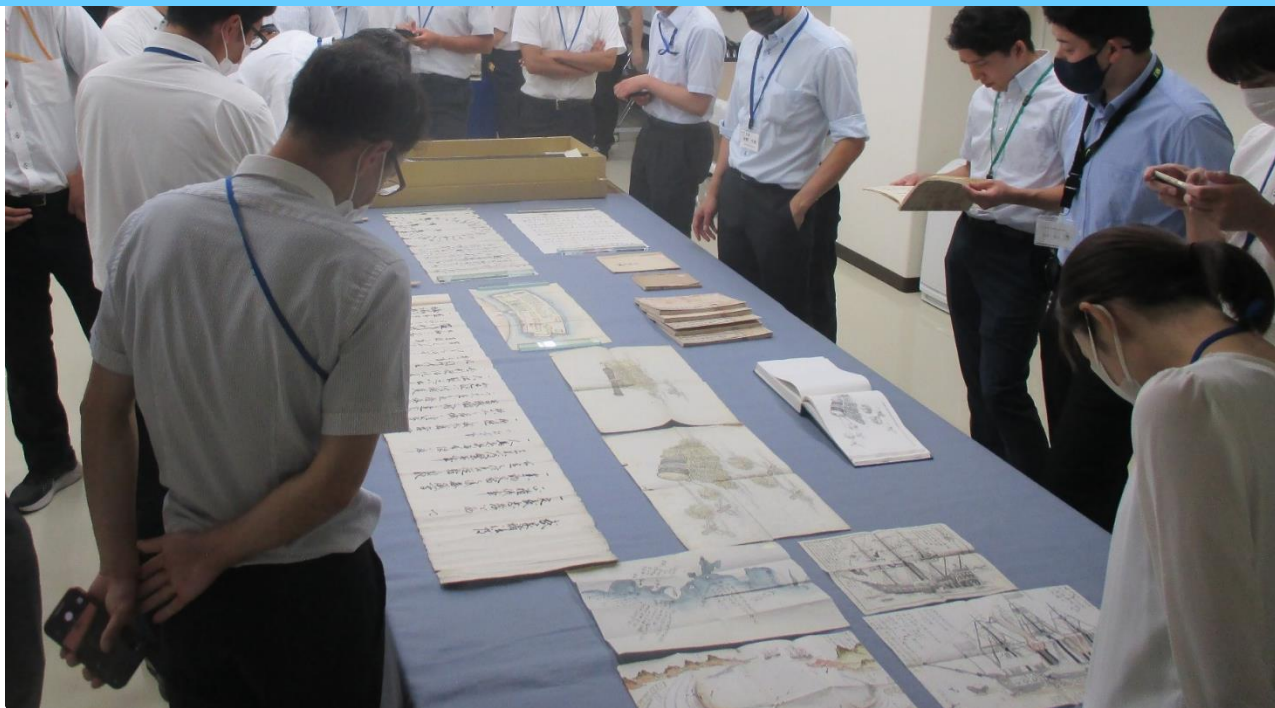
中学校教員 ワークショップ型研修