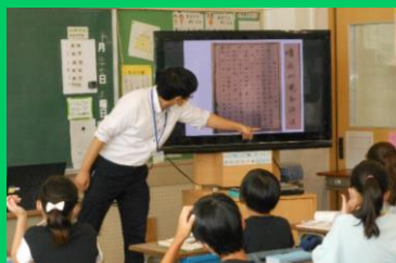
実際に教室等で行います