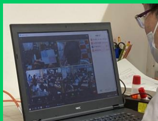
文書館と学校を つなぎます