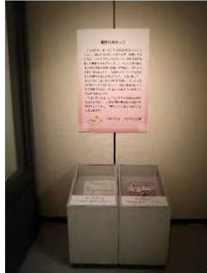
挨拶パネルと配布資料