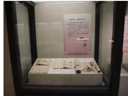
はじめに 展示資料