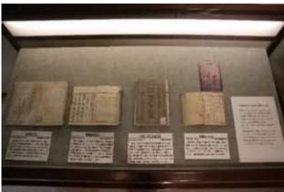
おわりに 展示資料