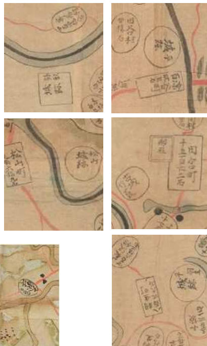
【写真7】 古城跡(国文研図)