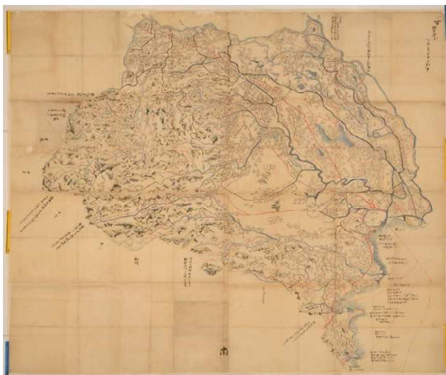
堀口家文書「武蔵国絵図」