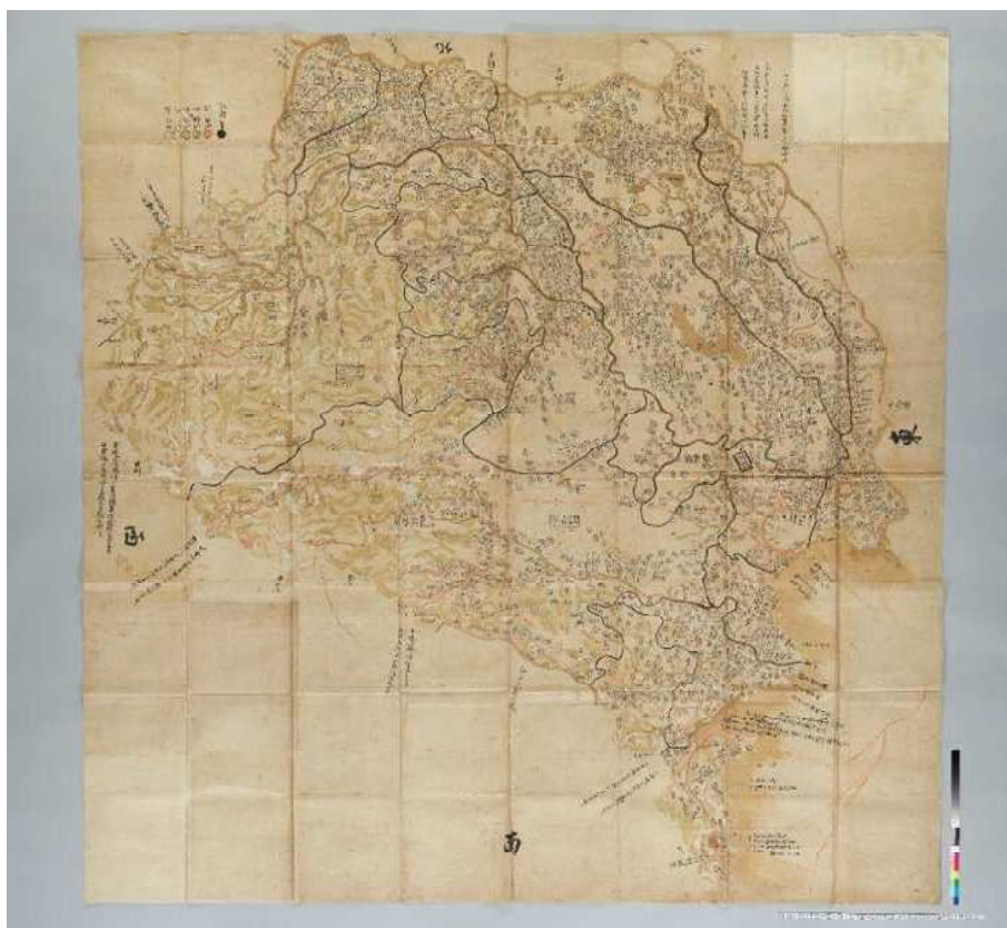
小室家文書「武蔵国全図」