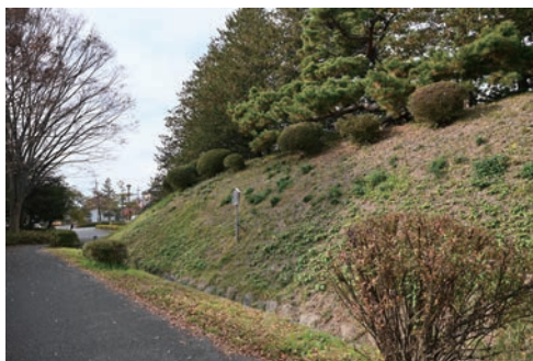
県指定旧跡 忍城跡 本丸土塁