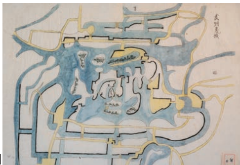
小室家文書 741 「武州忍城 [図] (写)」