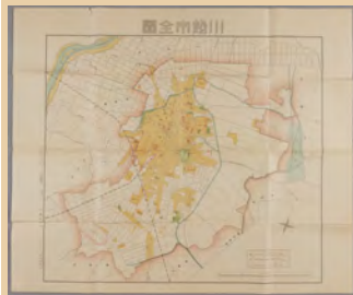
昭和 11 年の川越の町の地図 線路のようすがわかる！？