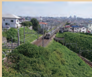
知られざる川越のビューポイント！ 川越ってこんなに高い土地だったっけ？ 向こうに見えるのはどの町でしょうか。