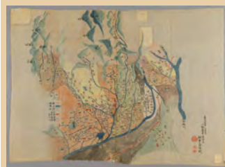
嘉永 6 年に写された 江戸時代の川越周辺の 絵図にも注目！