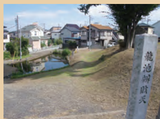
川越に湧き水が！？ 龍ヶ池井財天を訪ね この地の地形を観察しましょう！