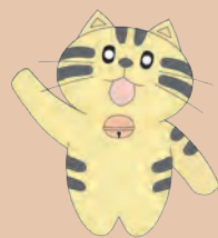
文書館マスコット もんじろう