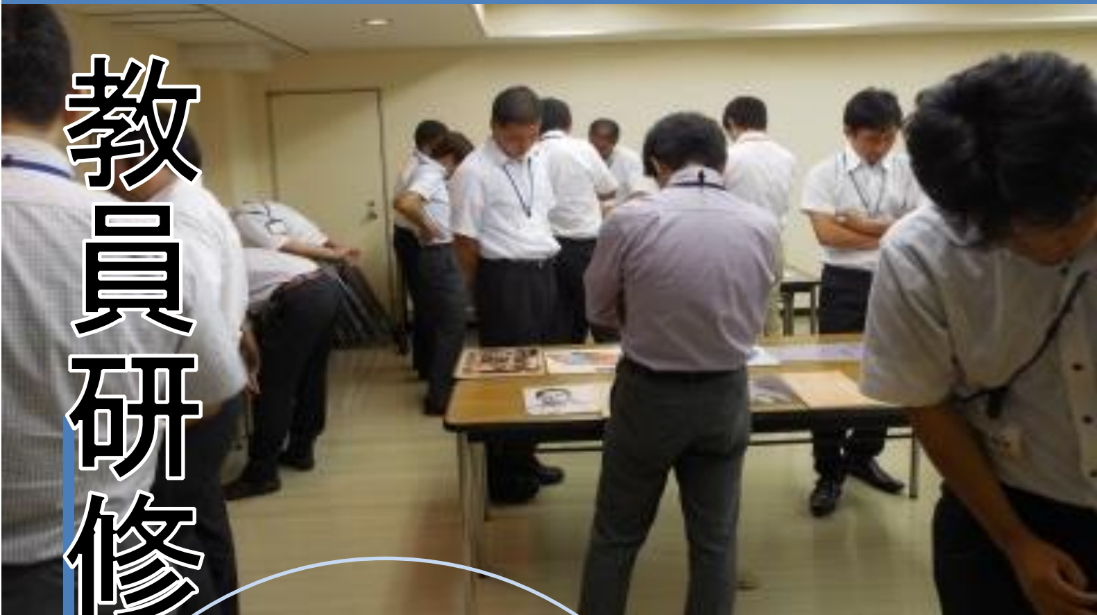
館内での社会科教育研究会

当館は、県や市町村主催の年次研修や各種学校の校内研修、市町村教育研究会、研究団体、研究サークルの研修の支援を行っています。収蔵資料の解説、行政文書や古文書、地図などの資料を活用した指導案の作成などの研修ができます。