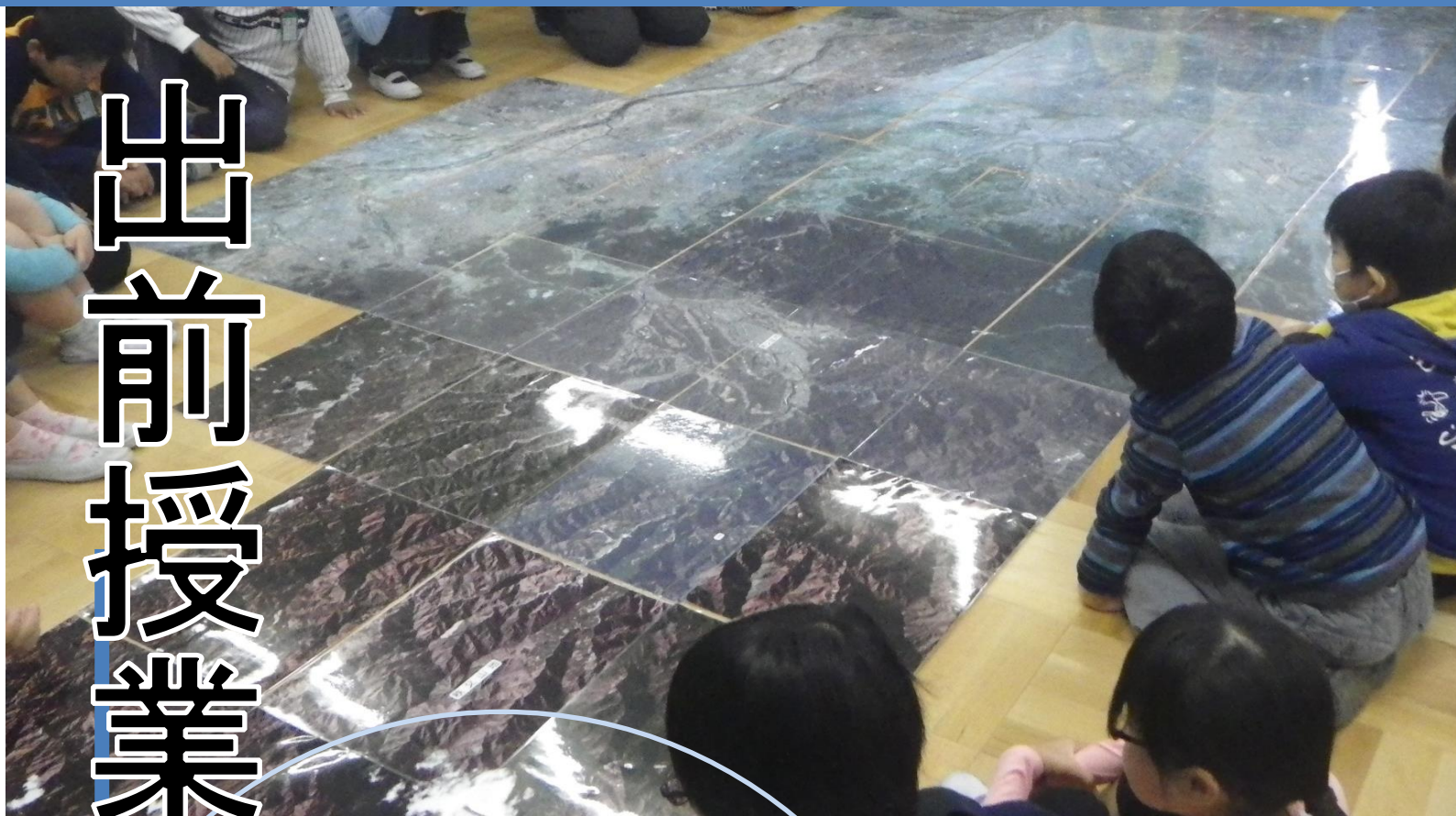
衛星写真（アースクリップ）の活用

埼玉県立文書館は、行政文書や古文書、地図、県史編さん資料、埼玉新聞社撮影報道写真など埼玉県に関する歴史的・文化的に価値のある資料を保存・整理・活用している教育機関です。