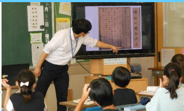
収蔵資料を使った社会科授業（小4 自然災害）