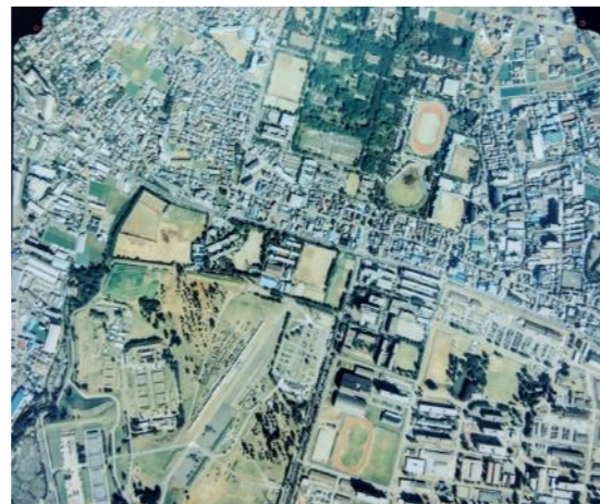
【S490820-036 今月いっぱい閉鎖される米軍北キャンプ 朝霞市】