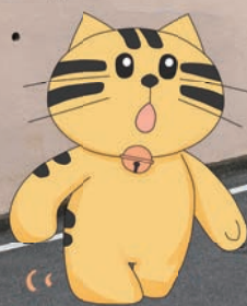
文書館マスコット もんじろう