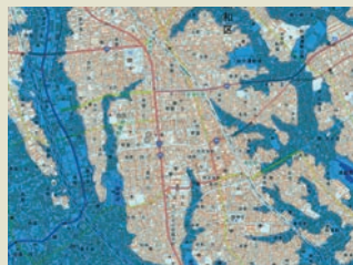
浦和に忍び寄る謎の模様