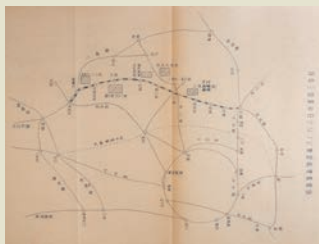
武蔵野線の予定線路が載る 埼玉県行政文書 A760