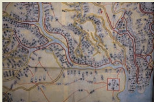
鴻沼も記載されている 江戸時代の文書 足立家文書 105