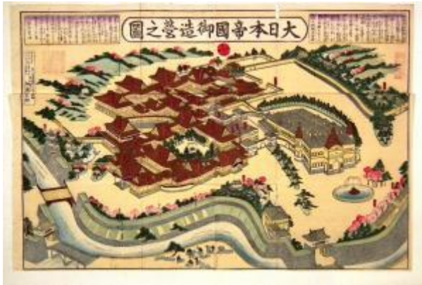
大日本帝國御造營之圖(高橋(周)家 108) 木版畫