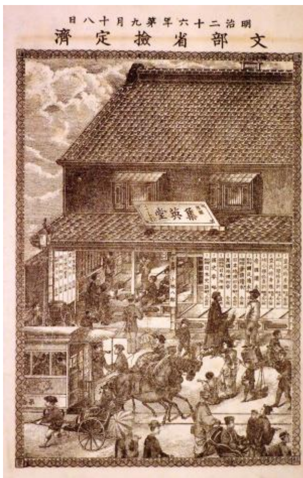
卷之一[集英堂]宇野家 2418)