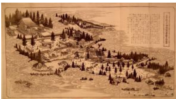
官弊大社氷川神社御改造宮壁分間(岸田氏収集 7305)