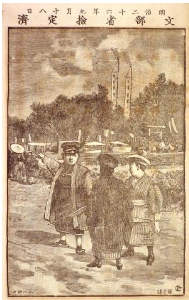
卷之二[まつり](宇野家 2424)