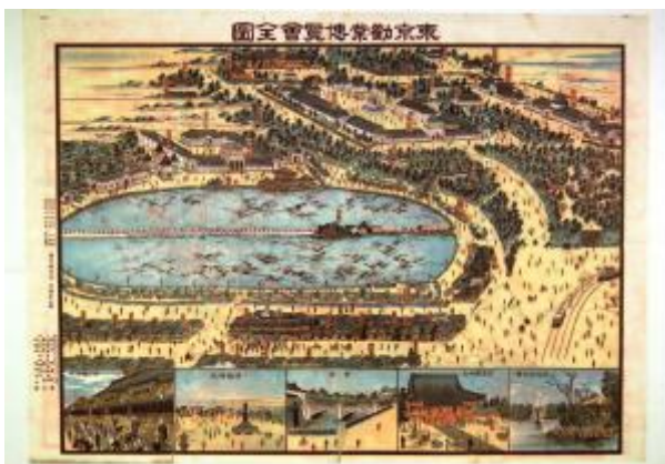
東京勸業博覽會全圖(鈴木(庸)家 9359) 石版畫