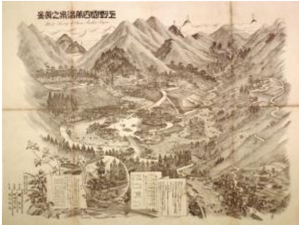
上野国四萬温泉之真景(鈴木(庸)家 9399)