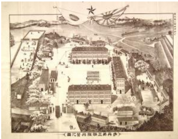
步兵第三聯隊兵營之圖(土屋家(旧土蔵坊) 435) 石版畫