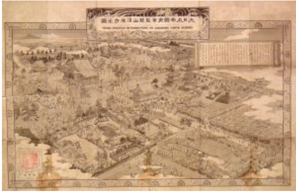
大日本帝国東京金龍山浅草寺之図(足立家 913)