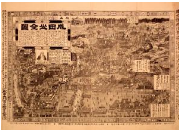
改正成田山全図(鈴木(庸)家 9398)