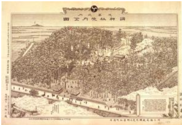
延喜式調神社境内全図(行政文書 明 2372)

重要文化財の川越の喜多院や調神社を始め、大宮の氷川神社、秩父の三峰神社、初代の秩父橋などの明治期の銅版画を紹介します。