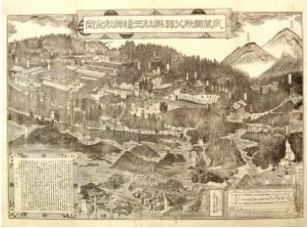
武蔵国秩父郡県社三峰神社全図(田中家文書 1350)