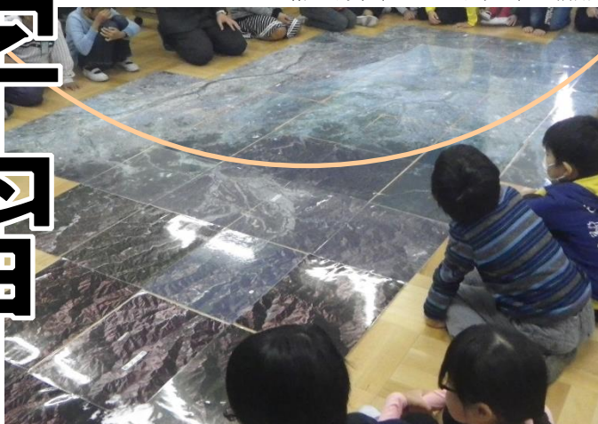
衛星写真（アースクリップ）の活用