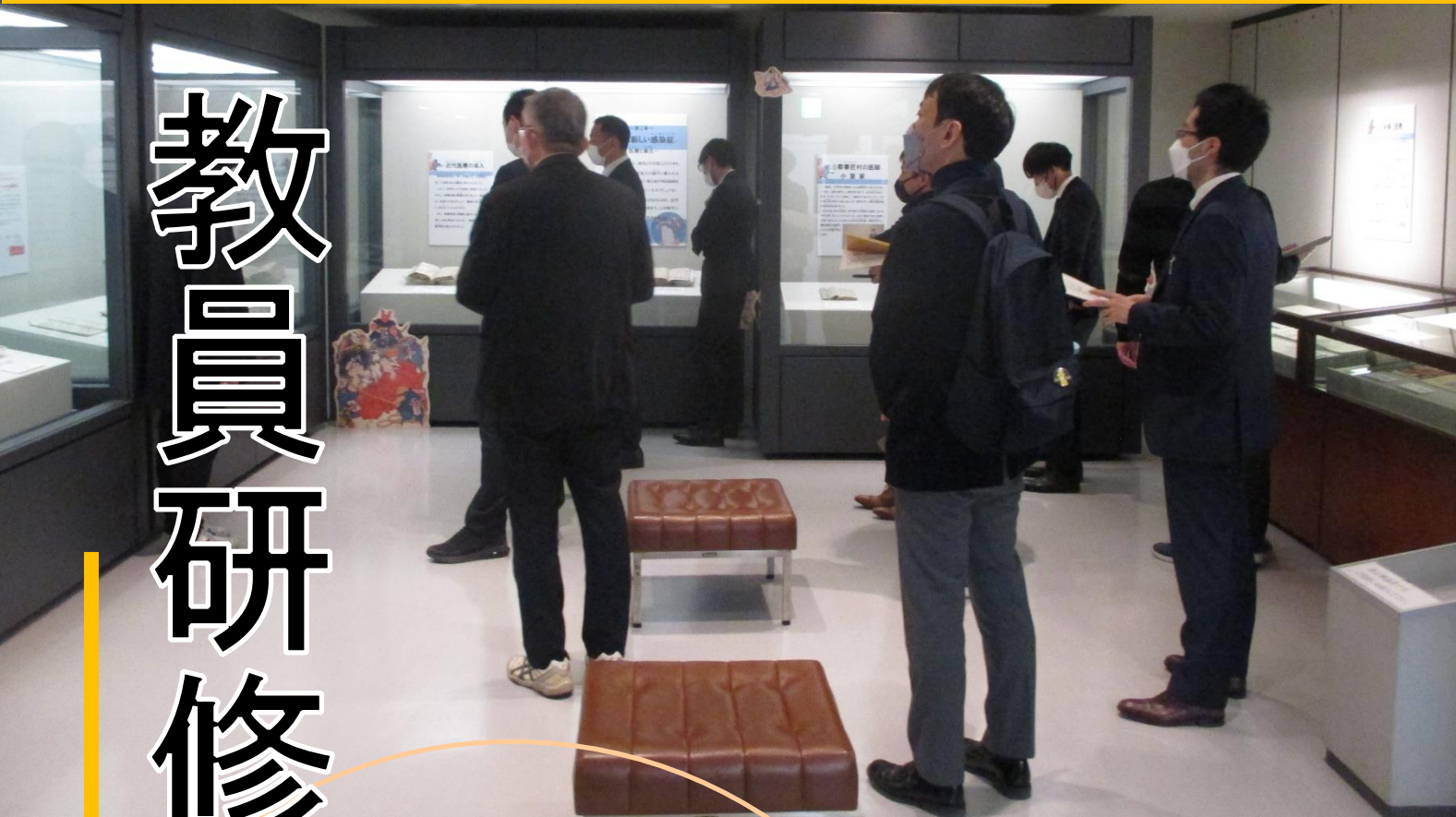
館内での社会科教育研究会（展示解説）

当館では、県や市町村主催の年次研修や各種学校の校内研修、市町村教育研究会、研究団体、研究サークルの研修の支援を行っています。収蔵資料の解説、行政文書や古文書、地図などの資料を活用した指導案の作成などの研修ができます。