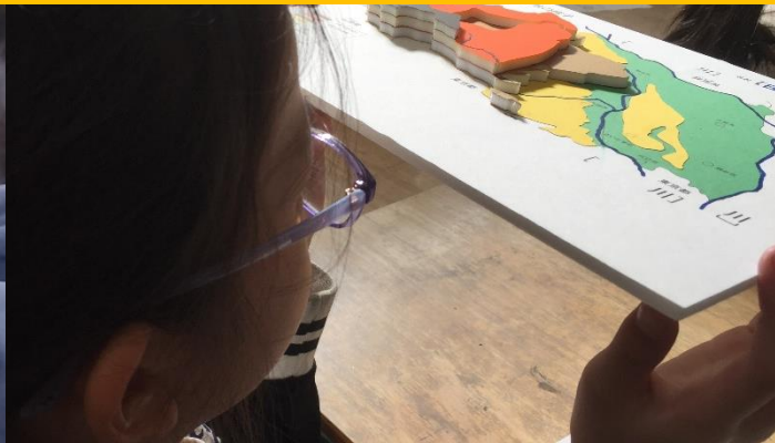
立体地図を使った調べ学習

埼玉県立文書館は、行政文書や古文書、地図、県史編さん資料、埼玉新聞社撮影報道写真など埼玉県に関する歴史的・文化的に価値のある資料を保存・整理・活用している教育機関です。