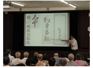
古文書解説講習会 : 고문서해독 강습회

입문·초급·중급의 수준별 강좌와, 하기집중의 고문서해독 강습회를 매년 개최하고 있습니다.