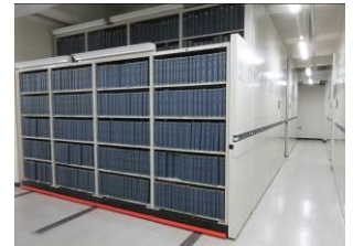
保存庫集密書架：보존고 집밀형 서가

귀중한 자료를 수집하고, 열람·활용을 할 수 있도록 정리하고 있습니다. 이 귀중한 자료를 장래의 현민에게 확실하게 전하고, 적절하게 보존하는 것은, 문서관 사업의 기초가 되는 업무입니다.