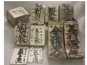
明治期の藍玉関係帳簿(深谷市飯塚家文書) : 메이지(明治)기의 쪽염색 관계의 장부 《후카야시(深谷市) 이이즈카(飯塚)가 문서》

이 고문서류는, 현이나 지역의 역사를 전하는 귀중한 자료입니다. 문서관에서는, 중세(中世)이후의 현내 각지에 남겨진 고문서를 다수 소장하고 있습니다.