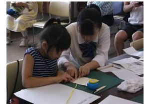
子供体験教室「巻物づくり」 : 어린이 체험교실 「두루마리 만들기」

학교교육에서 수장자료를 효율적으로 활용하는 기회로 출장강좌 나 교원연수, 사회체험 학습등을 실시하고 있습니다