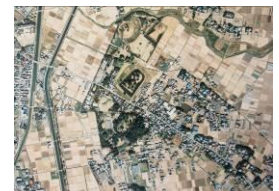
埼玉県全県航空写真 : 사이타마현 전현(全県) 항공사진 헤이세이 7 년(1995) A-16B-20(사키타마 고분군 부근)