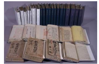
重要文化財「埼玉県行政文書」 : 중요문화재 「사이타마현 행정문서」

문서관에서는, 메이지(明治) 초년이후의 20 만점을 넘는 문서를 수장하고, 현재도 매년 계속적으로 자료를 받아 들이고 있습니다. 그 일부는, 나라의 중요 문화재로 지정되어 있습니다.