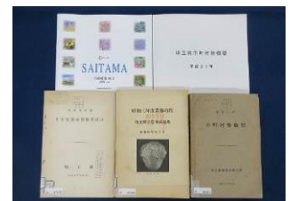
行政刊行物 : 행정간행물

또, 현내및 현외의 주요한 자치제사, 사전, 사전, 잡지등의 참고 도서도 열람할 수 있습니다.