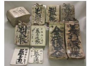
埼玉全県航空写真：埼玉全县的航空写真 1995 年 A-16B-20（埼玉县古坟群附近）