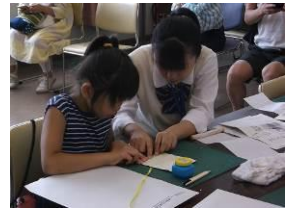
子供体験教室「巻物づくり」：孩子体验教室——制作卷轴

通过体验学习制作日本自古流传至今的印章、卷轴、和书（用日本纸张钉装成的书）及针对地图的讲习、立体地图制作等，提高孩子们对资料馆、地图等的关心和兴趣。