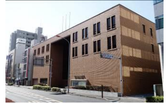
文書館外觀：資料館出現

2019 年 4 月，在经过大规模修缮之后重新开放之际，也同时迎来了开馆 50 周年。