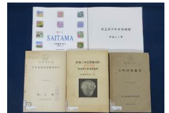
行政刊行物： 行政刊物

另外，还可以查阅到县内及县外的主要自治体的历史、字典和百科全书、杂志等的参考图书。