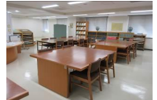
地図閲覧室：地图阅览室

可以阅读到许多与地域的历史和文化相关的丰富收藏资料。为了让大家可以有效地利用所需的各种资料，正在完善目录及搜索系统等查询系统。