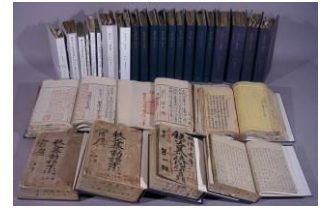
重要文化財「埼玉県行政文書」：重要文化财产 — 《埼玉县行政资料》

在本馆，收藏了自明治初期以来的 20 多万部资料，现在每年也在继续收集。其中的一部分，被指定为国家重要文化财产。