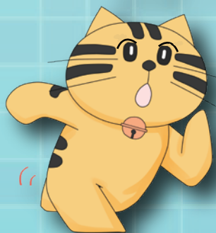
文書館マスコット もんじろう