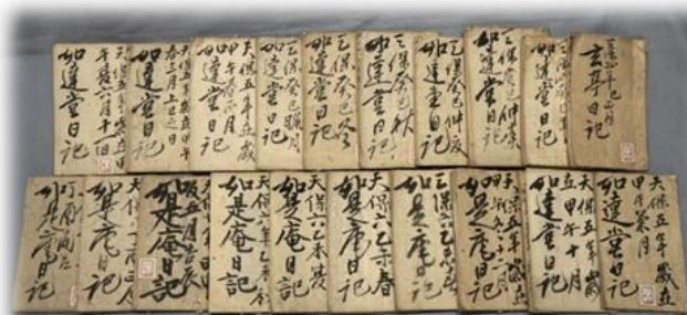
▲本書に収録した元貞の日記(部分)