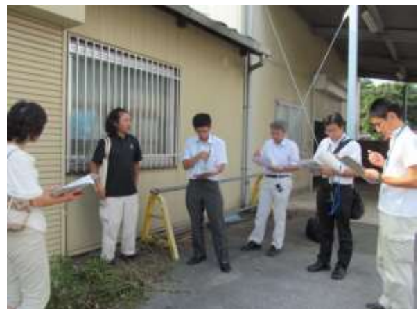
竜巻被害現地調査（松伏町）