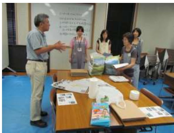
水濡れ資料のワークショップ

第一に、アンケートの分析結果の報告から行われた。分析結果の報告は、アンケートの設問を担当した委員から順次報告され、他の委員から意見を聴取した。そして、それらの意見を基に、再度、分析をかけることになった。