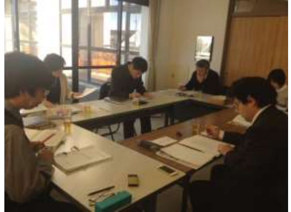
会議風景（幸手市社会教育課資料室）

今後の予定は、①差し替え写真ならびに修正原稿を座長に送付する、②座長による原稿の再編集後、各執筆担当者は最終確認を行う、③仕様書を作成し、年度内刊行を目指す、こととなった。