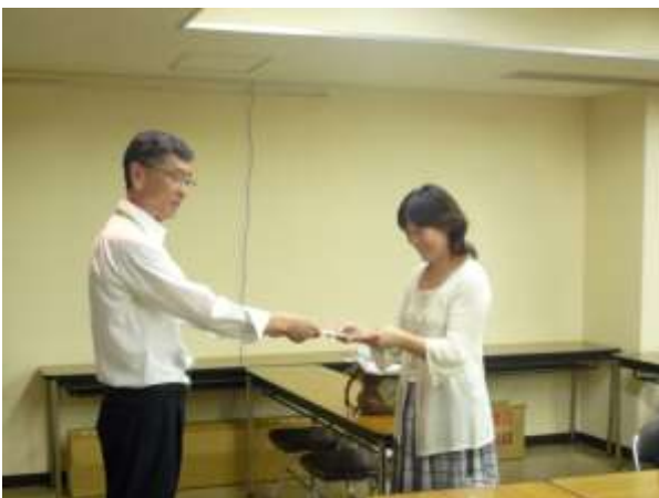
委嘱状の交付（埼玉県立文書館）

研究テーマについては、第7次専門研究委員会設置要項に基づき「地域史料の防災対策について」というテーマが与えられていたので、設置要項どおりに決定された。