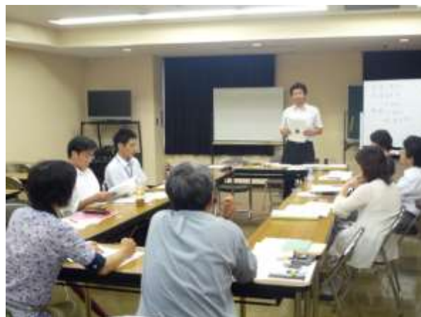
会議風景（埼玉県立文書館）

専門研の活動は2年間であり、その活動の成果である報告書は、平成26年度に迎える埼玉協設立40周年の際に配布することが、先に開催された理事会で決定されていた。