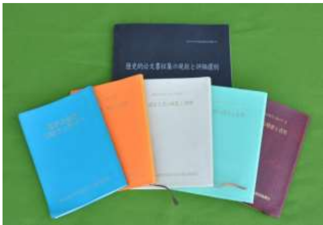
これまでの専門研刊行物（第1次～6次）

らびに災害初期マニュアル、第5章が第7次専門研の活動と埼玉史協の今後の展望の全5章である。資料編については、専門研の活動記録、アンケート結果の集計結果など、報告書作成するにあたって使用したものや参考となったものをまとめたものである。