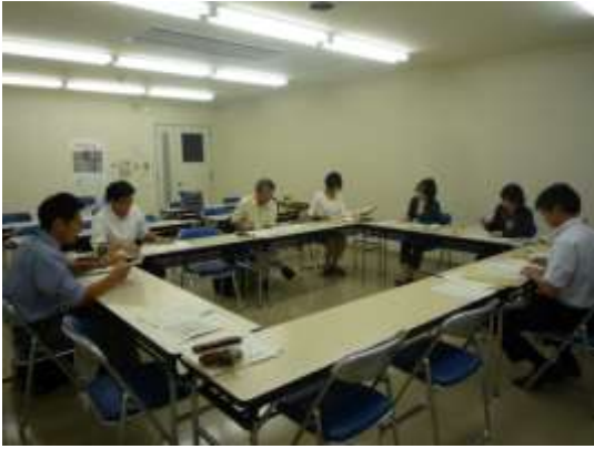
会議風景（久喜市公文書館）

だけでなく、専門研活動の成果を直接、埼玉協の会員をはじめとする関係者へ報告を行えるということで承諾を得た。