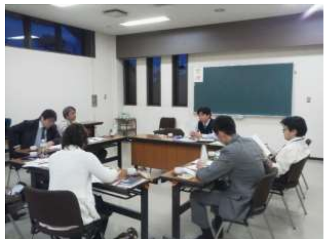
会議風景（行田市郷土博物館）

アンケートの送付までには会議を持てなかったため、メールにより内容修正を行った。そして、埼史協視察研修会（平成25年1月18日）時に内容と回答方法について最終確認を行った。最終的に回答