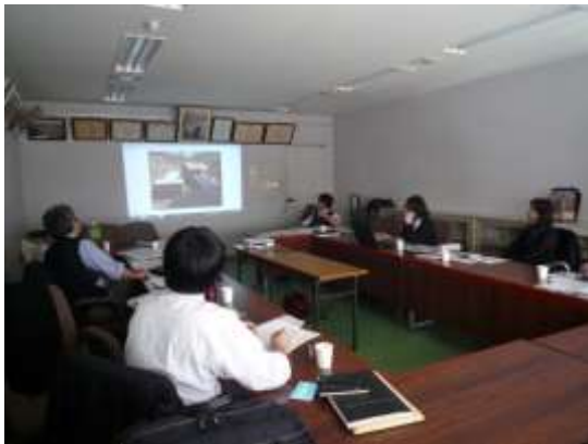
会議風景（三郷市役所）

第4回会議では、各委員が専門研発足時から会議やワークショップ、そして現地調査などの様々な場面で撮影を行ってきた写真を一通り確認し、報告書の内容に合わせて掲載する写真を選択した。