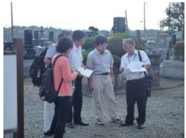
竜巻被害現地調査(熊谷市)

その内容は、災害初期マニュアルについては、緊急連絡先や災害直後にまず行うこと、また、文化財防災ウィールを参考にすることで話し合いを行った。また、防災マニュアルについては、博物館や全史料協で作成した防災マニュアルを参考にすると同時に、埼史協の活動スタンスから地域に所在する史料の防災も視野に入れたマニュアルを作成する。そして、史料所在目録の作成と管理について検討するよう確認を行った。