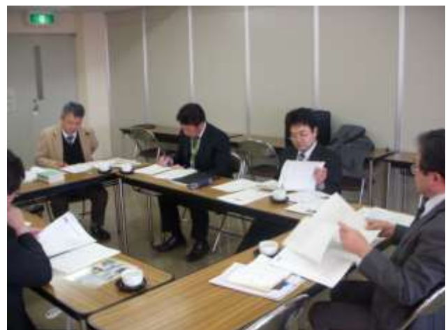
第7次専門研究委員会検討会（埼玉県立文書館）

そして、平成24年度総会において「第7次専門研究委員会設置要項」（資料編98頁）が審議され、承認を得ることができ、専門研の発足に至った。