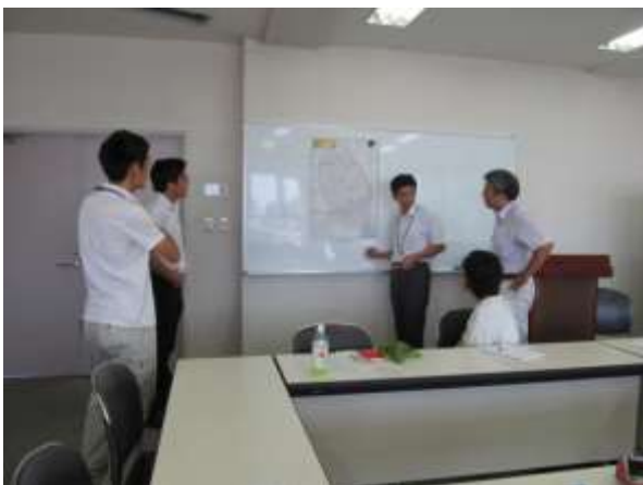
会議風景（春日部市教育センター）

現地調査は、平成25年9月2日にさいたま市、越谷市から松伏町にかけて発生した竜巻による被害調査を実施した。調査方法は、電話による文化財などの被害の有無について各文化財担当者から聞き取りを行った。その結果、越谷市では文化財などの被害は無いとの回答であった。また、松伏町では、民具などを収蔵している倉庫の屋根が飛ばされる被害が生じたとの聞き取り情報を得られたので、現地調査を行うこととした。調査はまず、文化財担当者から説明を受け、被害を受けた倉庫を視察した。その後、松伏町ならび越谷市で被害が発生した地区を巡回し、被害状況について実見した。