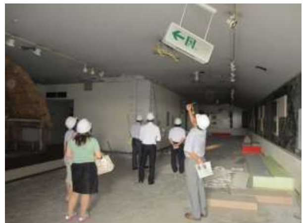
大風会館視察（春日部市）