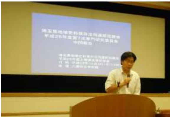
主管課長等研修会（八潮市立資料館）

アル」を作成するにあたって、その内容の検証、そして技術の習得を目的とするために実施したワークショップ（事前に水濡れ史料を用意しておき、自然乾燥法と真空パック法の両方の処理）について報告を行った。