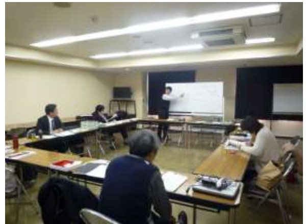
会議風景（埼玉県立文書館）

理事会での意見を反映させて報告書の内容を最終確認するとともに、全委員による校正を行い校了とした。